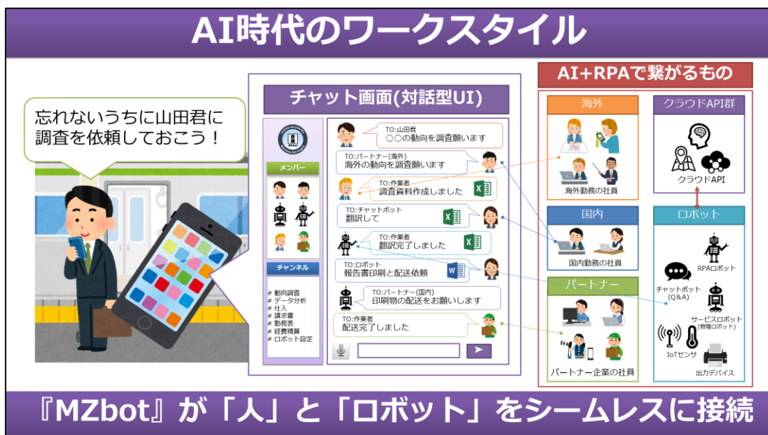
豆蔵が考える AI 時代のワークスタイル

『MZbot』はチャット画面を使った問い合わせ(Q&A)機能だけではなく、RPA ロボット、サービスロボット、クラウド API、IoT センサ等と連携し、社員一人ひとりのデジタル秘書(パーソナルアシスタント)として企業活動における多くの業務を代行します。これにより、『MZbot』は「AI 時代のワークスタイル」を実現します。