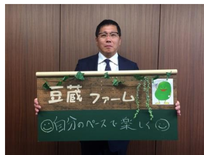
豆蔵ファーム開園式の様子 2017.11.15 朝