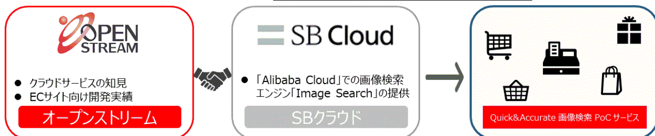
Image Search について

※2 「クラウドコンピューティング EXPO【春】」の詳細は、こちら ( https://spring.japan-it.jp/ja-jp/about/cloud.html ) をご参照ください。