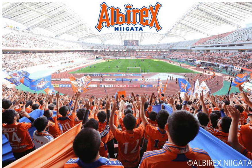
公式モバイルサイト「モバイルアルビレックス Z」